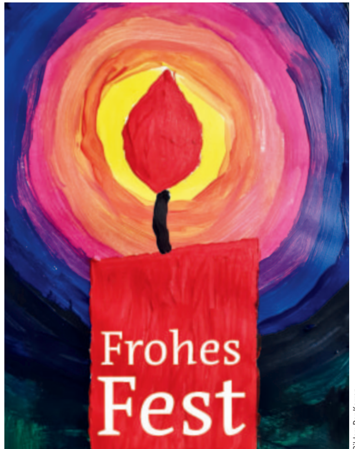
Bilder: Der Karren

Die fünfte Jahreszeit hat begonnen und damit auch der Kartenvorverkauf für die traditionelle Karnevalsparty des Karren am 16. Januar im Haus der Nachbarschaft in Sankt Augustin-Hangelar. Beginn ist um 17:30 Uhr, Einlass ab 17:00 Uhr. Karten zum Preis von 10 Euro können bestellt werden unter siebert@karren.de .